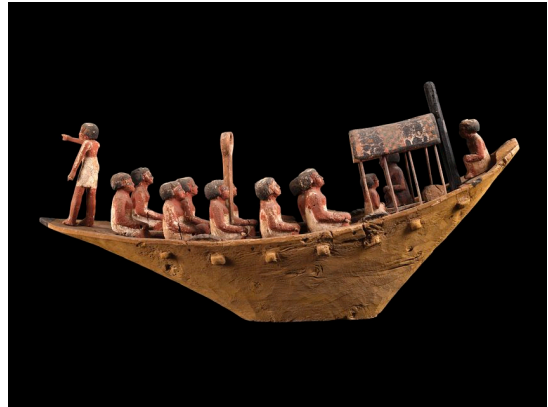
Modellino di barca. Inizio del Medio Regno. Legno dipinto. Pozzo funerario di Usermut e Inpuemhet Inpu, Saqqara. Il Cairo, Museo Egizio.

Nella seconda sala l'attenzione del visitatore viene inevitabilmente catalizzata dallo splendido sarcofago antropoide esterno di Tuya, il cui sguardo ipnotico contornato di lapislazzuli è stato scelto, non a caso, come immagine rappresentativa della mostra. Insieme a suo marito Yuya, Tuya venne sepolta nella Valle dei Re, nella tomba denominata KV 46, con un corredo quasi comparabile a quello di un sovrano. Questa coppia ricevette certo un trattamento speciale, dovuto al fatto che si trattava dei genitori della "grande sposa reale" di Amenhotep III, padre a