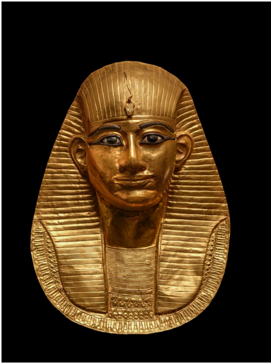
Maschera funeraria d'oro di Amenemope. XXI dinastia, Terzo Periodo Intermedio, regno di Amenemope. Oro, cartonnage. Tombe reali, Tanis. Il Cairo, Museo Egizio.

sua volta di Amenhotep IV/Akhenaton (XVIII dinastia). Quando, nel 1905, la sepoltura venne rinvenuta dall'archeologo James Quibell, questi si stupì per la ricchezza dei corredi funerari, nonostante non fosse stata del tutto risparmiata dai saccheggi.